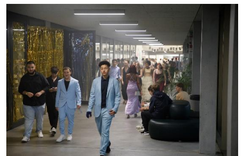
Abschlussball dritte Klassen (kurzer Film dazu auf Instagram und auf unserer Homepage unter «News»)