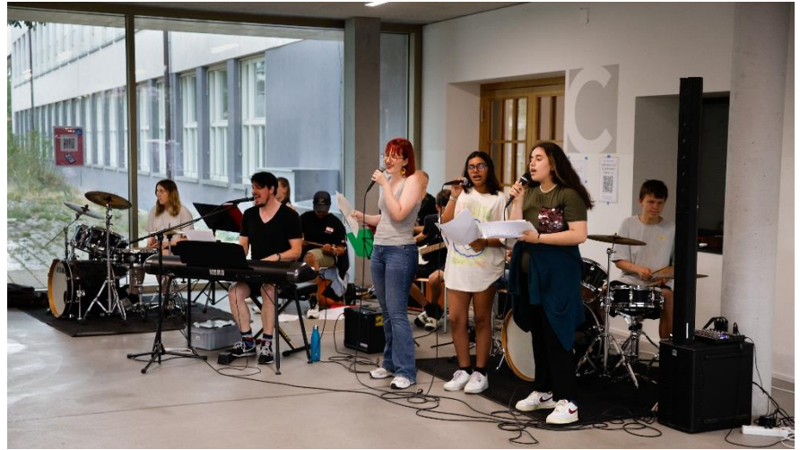
Band und Chor begrüßen die Gäste am Abend «Sandgruben präsentiert sich»